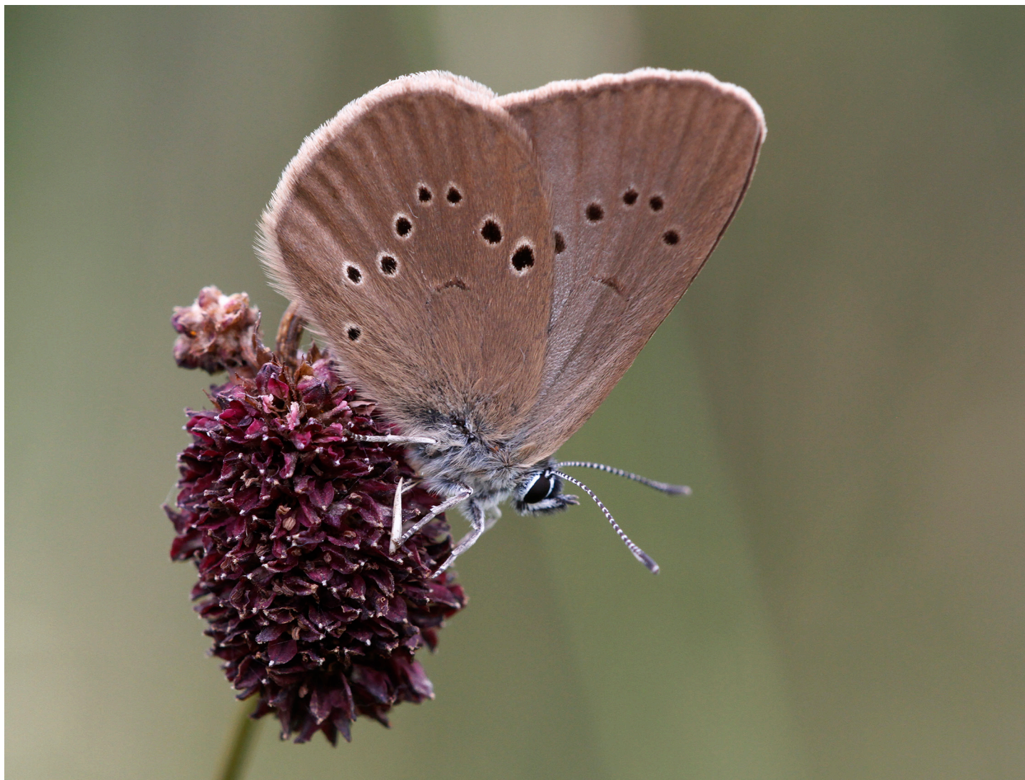
AZURE DES PALUDS SUR SANGUISORBE, FORÊT DE GALMIZ, MAI 2023, NATUREL

Plus d'information sur la formation de « Chef-fe de projet nature et environnement »