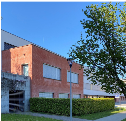
Die Schule von Villars-Vert hat beschlossen, die Lorbeerhecke, die für die Biodiversität überhaupt nicht von Interesse war, zu entfernen und durch eine Hecke aus verschiedenen, einheimischen Pflanzenarten zu ersetzen