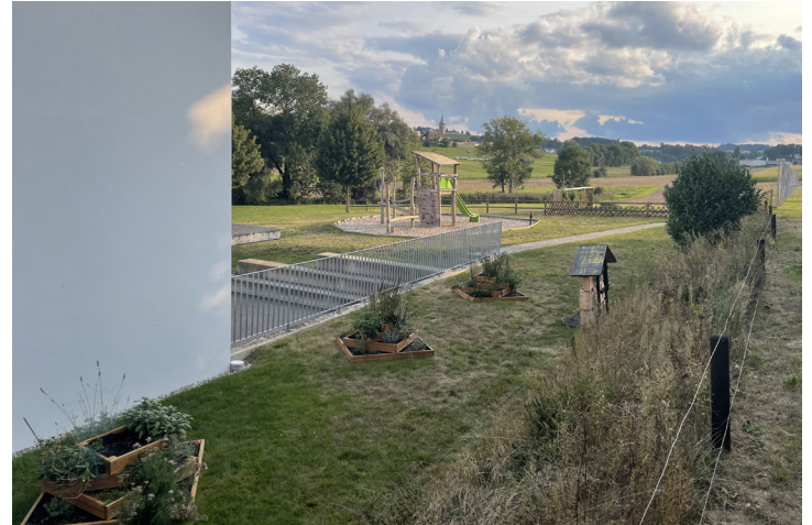
Um mehr Biodiversität auf ein nur aus Rasen bestehendes Gebiet zu bringen, hat die Lossy-Schule Kräuter- und Blumenkübel gebaut und ein grosses Insektenhotel aufgestellt